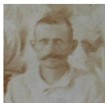
Chalouš detail rok 1916